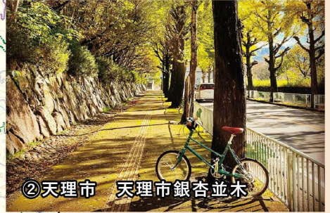
②天理市 天理市銀杏並木