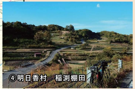
④明日香村 稲淵棚田